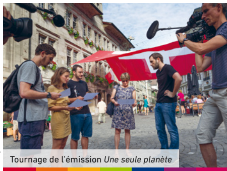
Tournage de l'émission Une seule planète

En signant l'accord de la COP21, la Suisse s'est engagée à réduire de 50% ses émissions directes de gaz à effets de serre d'ici à 2030. Pour parvenir à ce résultat, il faut changer de modèle. Certes, le Gouvernement et le Parlement doivent œuvrer de leur côté pour instaurer des lois incitatives ou contraignantes et mettre en place des politiques ambitieuses. Mais chacun peut également agir à sa modeste échelle, en faisant sa part. Alors que faut-il changer? Comment adopter les bonnes pratiques et par quoi commencer?