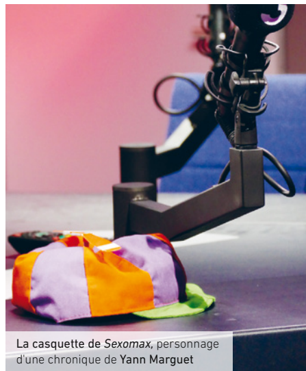
La casquette de Sexomax , personnage d'une chronique de Yann Marguet

À 17h30, silence dans l'assemblée, l'alter ego décomplexé de Yann Marguet, Sexomax , entre en scène pour une chronique sexuelle à l'humour poétiquement grivois. Carton plein! Les rires fusent parmi les personnes présentes. Après l'immanquable photo de groupe, une chose est sûre, les membres sont repartis conquis!