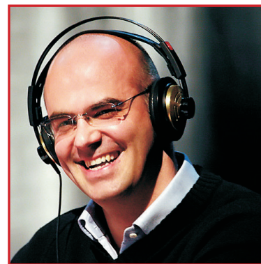
Alain Berset

La SRT Fribourg a profité de cette occasion pour se faire mieux connaître et agrandir le nombre de