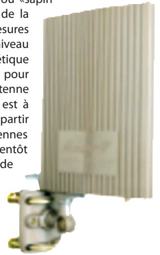
Antenne TNT extérieur (29 x 18 x 2 cm!)